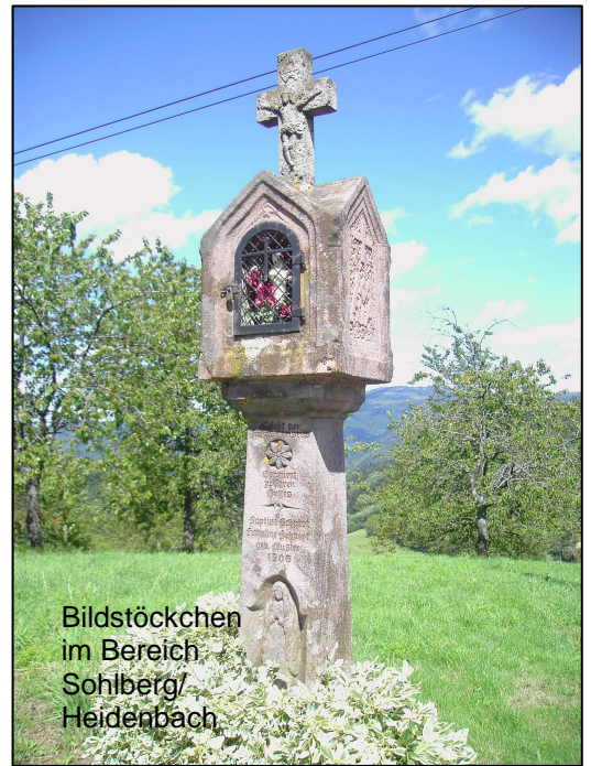
Bildstöckchen im Bereich Sohlberg/ Heidenbach

Von hier geht es zunächst eben über das Langeck, und dann stetig immer weiter über das obere und untere Kohleck in Richtung Ottenhöfen. Bei der Erwin-Schweizer-Schule überqueren wir den Schulhof, folgen dem asphaltierten Schulweg und kommen wieder zum Wegweiserstandort „Blustenweg“, den wir vom Beginn unserer Wanderung schon kennen. Von hier sind es dann nur noch wenige Minuten bis zum Ausgangspunkt unserer Wanderung in der Ortsmitte.